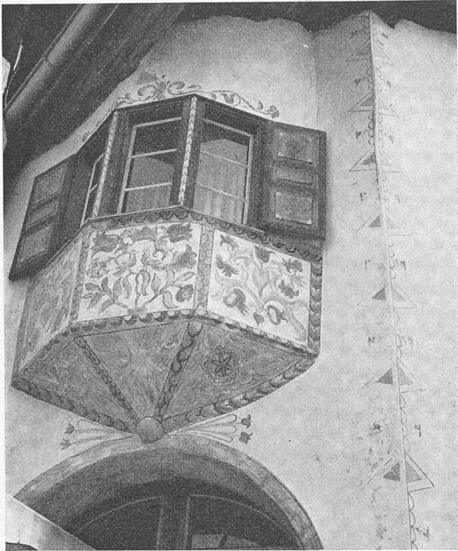
Besondere Liebe lässt man dem Dekor der kleinen Erker angeidehen, die soviel Lebendigkeit und Vorwitz in die Fassaden bringen

engadinische Bauweise, die in Guarda eine besondere Prachtentfaltung erlebt, welche wiederum auf ein wohlhabendes Ortsbürgertum des 17. und 18. Jahrhunderts zurückführt. Im Jahre 1623 wurde das 1160 erstmals urkundlich erwähnte Dorf durch österreichische Truppen vollständig niedergebrannt. Dies zu einer Zeit, da die Bündner Pässe wichtige Schlüsselstellen der alten Reichsstrassen waren, da schwer bepäckte Säumerkolonnen durchs Dorf zogen. Sie führten Salz von Salzburg nach Italien und umgekehrt Käse und andere bäuer-