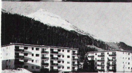
Überbauung Rietstrasse, Elektrizitätswerk der Landschaft Davos; total 33 Wohnungen; Anschlusswert ca. 400 kW

Star Unity AG Fabrik elektrischer Apparate Zürich, in Au/ZH Tel. 01 75 04 04