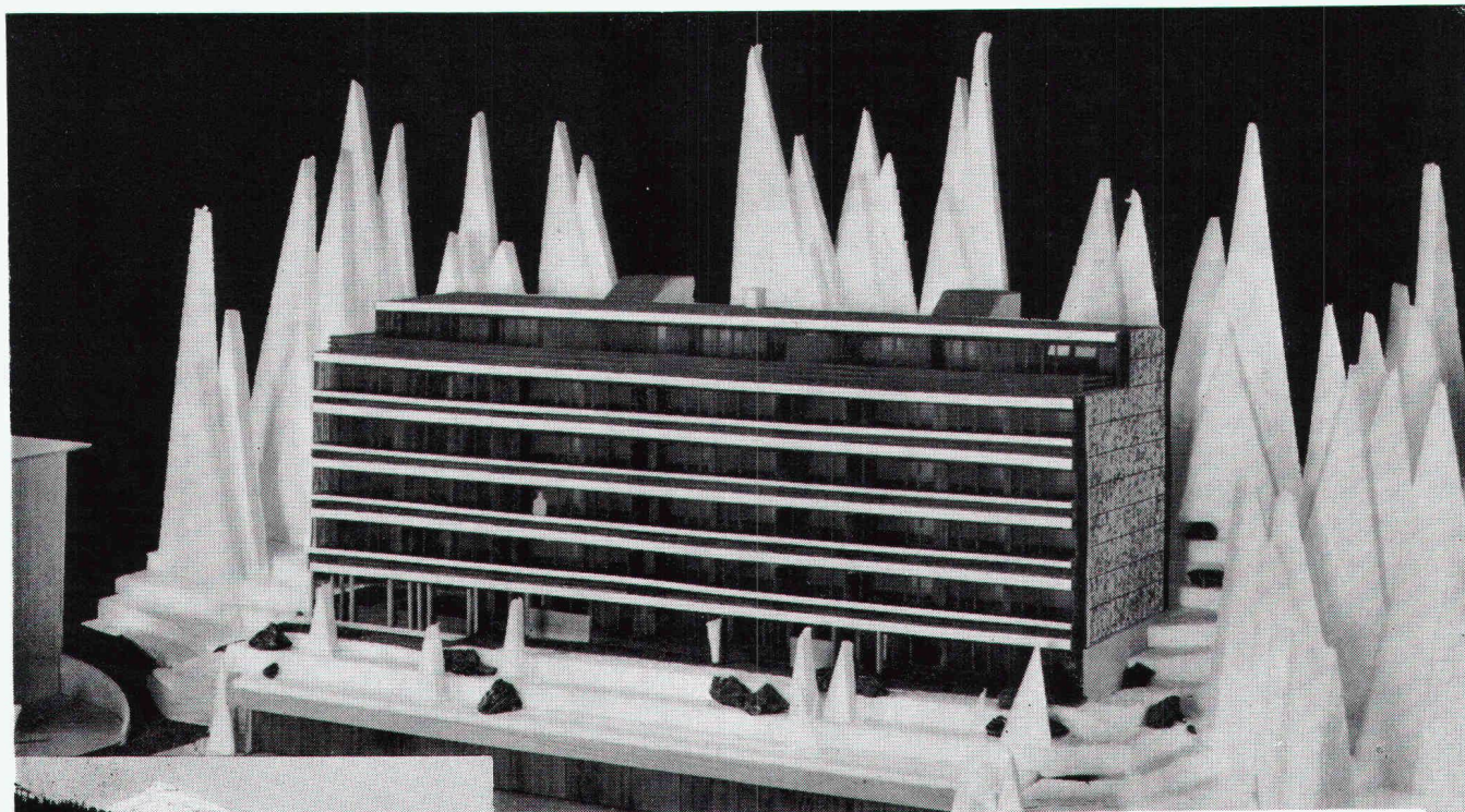
Überbauung Meiliboda 2, Elektrizitätswerk Arosa; total 30 Wohnungen; Anschlusswert ca. 380 kW

Herausgegeben von der Verlags-AG der akademischen technischen Vereine, Zürich