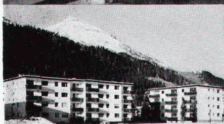
Überbauung Rietstrasse, Elektrizitätswerk der Landschaft Davos; total 33 Wohnungen; Anschlusswert ca. 400 kW

Star Unity AG Fabrik elektrischer Apparate Zürich, in Au/ZH Tel. 01 75 04 04