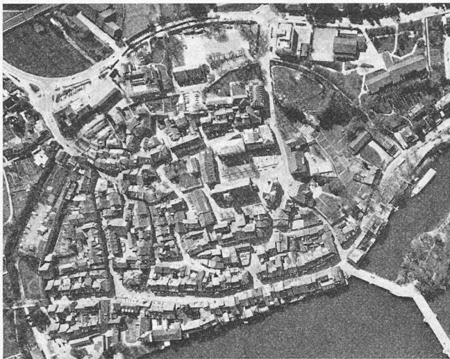
Rheinfelden – noch ist die geschlossene, mittelalterliche Stadanlage intakt...

Es handelte sich darum, am Beispiel von Restaurierungen oder Sanierungen, des Inkraftsetzens von Vorschriften, des Schaffens von Fussgänger- oder Grünzonen oder der Neubelebung erhaltenswürdiger Quartiere Verwirklichungen auf dem Gebiet der Denkmalpflege und des Heimatschutzes aufzuzeigen oder Projekte mit abgeschlossener Detailplanung und gesicherter Finanzierung vorzuweisen.