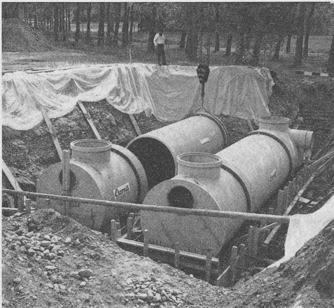
Vorfabrizierte Rückhaltebecken für Lucens VD