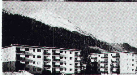
Überbauung Rietstrasse, Elektrizitätswerk der Landschaft Davos; total 33 Wohnungen; Anschlusswert ca. 400 kW