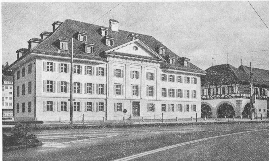
Das rekonstruierte Waisenhaus bei der Spreuerbrücke, rechts der aufgestockte Herrenkeller und das alte Zeughaus

Die Stadt Luzern ist äusserst arm an repräsentativen Bauten aus der Zeit des frühen Biedermeiers. Dem Waisen-