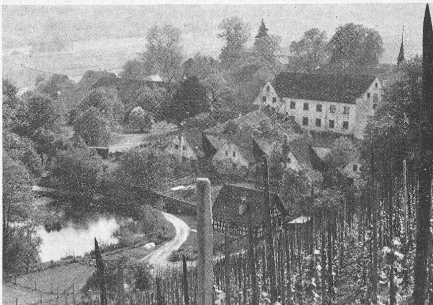
Das Kartäuserkloster Ittingen. Es ist kaum begreiflich, dass die thurgauische Regierung so lange zögerte, diese einzigartige Anlage zu erwerben und damit vor dem Verfall zu retten