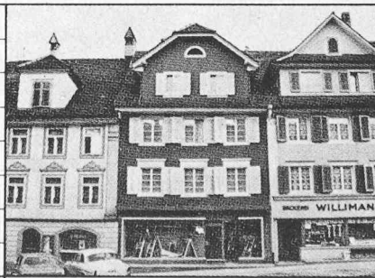
Karteiblatt zur Methode der Denkmalpflege (Seite 116). In Bildmitte das Wohn- und Geschäftshaus der Tuchhandlung Lüthi

BESCHREIBUNG 3-gesch. verputzter Massiv/Fachwerkbau über Rechteckgrundriss, schmal-seitig zum Flecken. Gleichflüchtig zwischen den Nachbarbauten. Gemeinsame Trauf- und Firstlinie mit Nr. 237, jedoch versetzt gegenüber Nr. 239. Fassade (N): Hochrechteckiges unauffälliges Zeilenelement. 3 regelmässig gereichte Fensterachsen in den OG, modernistischer störender Ladeneinbau, von den OG durch breites Vordach getrennt. Massige 2-achsige Giebelgauben mit Krüppelwalmen. An Rückseite 2-gesch., geschosswise abgetrepter Flachdachvorbau, der 2 Drittel der Hausbreite einnimmt. Garten mit plattengedeckter Stützmauer zur Gerbergasse. Bedeutend als Glied der geschlossenen Häuserzeile.