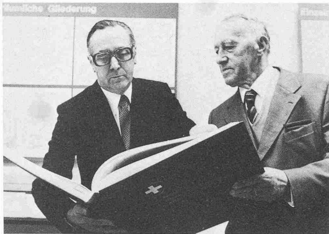
Eduard Imhof (rechts) zusammen mit Bundesrat Hans Hürlimann an der Feier zum Abschluss der 1. Auflage des «Atlas der Schweiz»

konfessionelle Glaubensunterschiede solche Eintracht zu trüben. Selbstaufgelegter Verzicht auf Gebietszuwachs, Nicht-einmischung in fremde Händel, wehrhafte Neutralität haben die Schweiz auch in jüngerer Zeit vor Krieg bewahrt und den Wohlstand ihrer Bevölkerung gehoben.