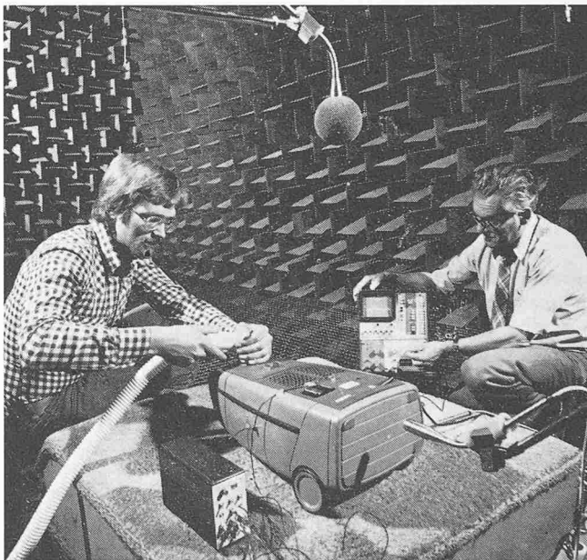
Inneres des schalltoten Raumes, in dem Schallmessungen an einem Staubsauger durchgeführt werden. Wände, Fussboden und Decke sind mit speziell profilierten Blöcken aus einem Material mit hohem Schallschluckgrad verkleidet