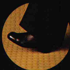
hoher, sicherer Gehkomfort