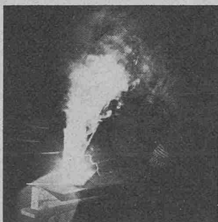
Ohne Schweissrauchabsaugung gelangt der Schweissrauch direkt in die Atmungszone des Schweissers.

Es ist unvermeidlich, dass beim Schweißen durch Verdampfen von Metallen und durch Oxidation Rauch und Gase in verschiedenen Mengen und Zusammensetzungen je nach Schweissverfahren und Art der verwen-