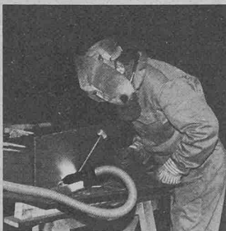
Dank der Schweissrauchabsaugung kann der Schweisser saubere Luft einatmen, und er wird nicht durch den Schweissrauch belästigt und gefährdet.

deten Elektroden entstehen. Dieser Schweissrauch ist aber nicht nur unangenehm und störend, er kann auch – je nach Konzentration – sehr gesundheitsschädigend sein. Daher wurden von verschiedenen Instituten die maximalen Arbeitsplatzkonzentrationen (MAK-Werte) für die meisten Schadstoffe festgelegt. Die MAK-Werte geben die maximal erlaubte Arbeitsplatz-Konzentration an, bei der, während eines 8-Stunden-Arbeitstages, über mehrere Jahre keine Gesundheitsschäden zu erwarten sind. In einigen Ländern wurde wegen der Gefährlichkeit von Schweissrauch der entsprechende MAK-Wert von 10 mg/m 3 auf 5 mg/m 3 herabgesetzt.