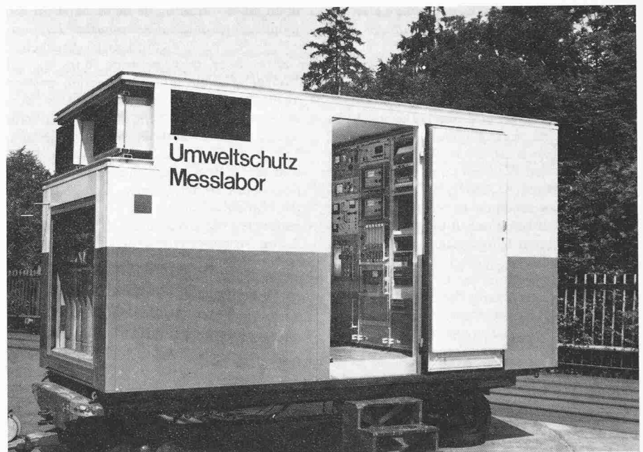
Bild 1. Mobiles Umweltschutz-Messlabor für Immissions- und Emissionsmessungen

Aufgrund der günstigen Abmessungen ist der Container einfach mit einem LKW oder in einem Bahnwagen zu transportieren.