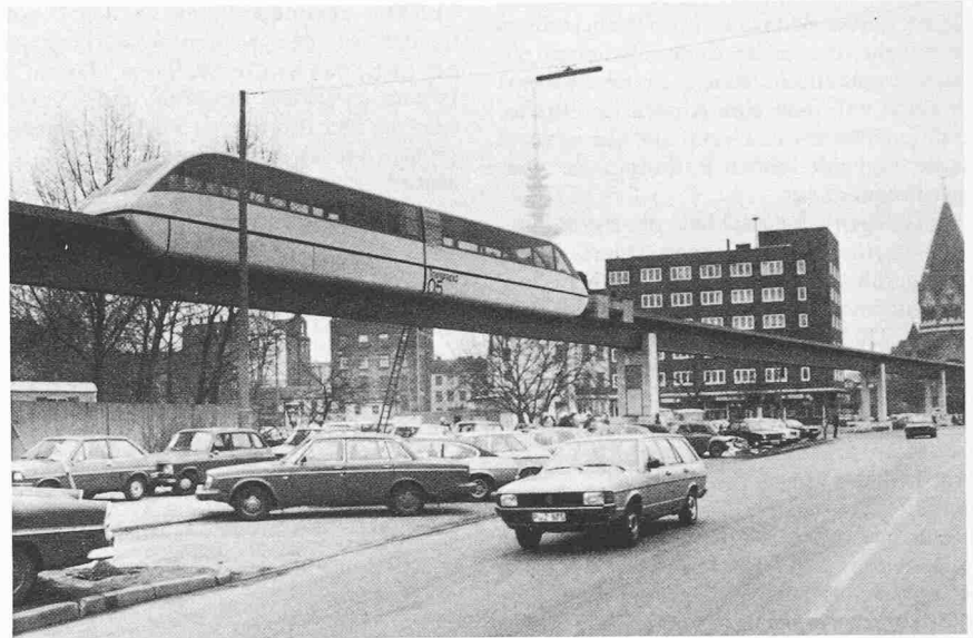
Die Magnetschwebbahn «Transrapid 05» ist eine der Attraktionen der Internationalen Verkehrs-Ausstellung «IVA '79» vom 8. Juni bis 1. Juli in Hamburg. Die Bahn, die auf einer 900 Meter langen Demonstrationsstrecke zwischen dem Messehauptingang Jungiusstrasse und dem Freigelände Heiligengeistfeld verkehrt, besteht aus zwei je 13 Meter langen Triebwagen, wiegt insgesamt 36 Tonnen und kann 68 Fahrgäste befördern. Die Anlage wird mit Förderung des Bundesministers für Forschung und Technologie von der Projektgruppe IVA der Firmen Krauss-Maffei + Messerschmitt-Bölkow-Blöhm (MBB) und Thyssen Henschel errichtet.

(AD) Die beiden «Fenster» in der Erdatmosphäre für elektromagnetische Wellen, die von Himmelskörpern und anderen kosmischen Objekten ausgesandt werden und zu uns gelangen können, stellen nur einen relativ kleinen Ausschnitt aus dem Spektrum dar. Es handelt sich um das sog. optische Fenster für sichtbares Licht und das – wesentlich breitere – Radiofenster, über das die Radioteleskope Strahlung aus dem Weltraum empfangen. Der Grossteil fällt jedoch der atmosphärischen Absorption durch Ozon, Wasserdampf, Kohlendioxid und andere Moleküle zum Opfer. Und Wellen niedriger Frequenz jenseits des Radiofensters, d. h. Wellen von mehr als 20 m Wellenlänge, werden durch die Ionosphäre abgeschirmt. So war es bisher nur mit Raketen sonden und Forschungssatelliten von Positionen aus dem Kosmos auch in den von der Erdoberfläche aus nicht zugänglichen Frequenzbereichen zu erfassen. Die Erkenntnisse, die man in relativ kurzer Zeit damit gewinnen konnte, haben das «Weltbild» der Astrophysik bereits wesentlich verändert und erweitert.