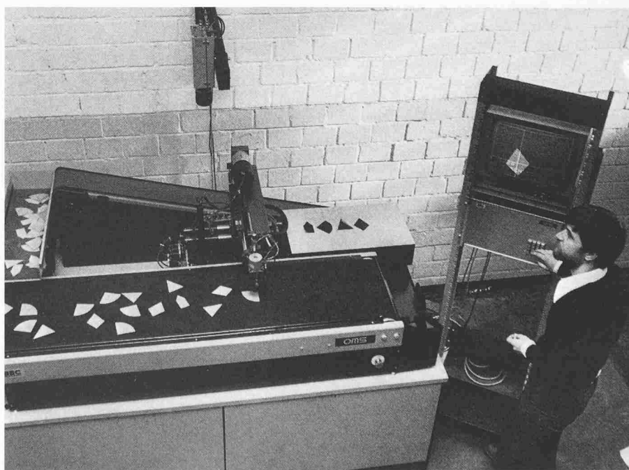
Das «Auge» des Roboters ist eine Fernsehkamera (oben), das «Gedächtnis», das die Stanzteile auf dem Fliessband identifiziert, ein Mikroprozessor (rechts), sein Arm ein Manipulator, der die Teile ergreift und so genau über die entsprechenden Löcher des Ablagekastens hält, dass sie hineinfallen können

Fachleute sehen Verwendungsgebiete dieser