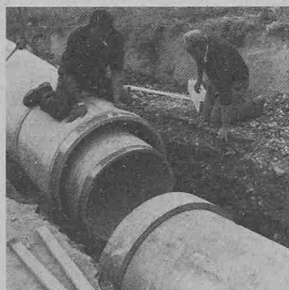
Das Verbinden der Doppelrohre im Graben. Die Konzentrität der beiden Rohre in der Einbaulage wird durch zwei Auflagerplatten gewährleistet, die an der Kupplung des Innenrohres angebracht sind

wasserqualität des Pumpwerkes durch die Kläranlage ungünstig beeinflusst werden könnte.