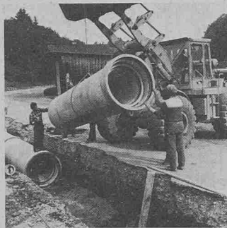
Das Doppelrohr wird in den Graben gebracht, nachdem unmittelbar zuvor das Innenrohr mit Hilfe des Baggers ins Aussenrohr geschoben wurde

Die Kläranlage Einsiedeln wurde im Herbst 1978 in Betrieb genommen. Sie liegt ca. 400 m oberhalb eines Grundwasserpumpwerkes, dessen einwandfreie Funktionieren für die Trinkwasserversorgung von Einsiedeln absolut notwendig ist. Bei der Standortfestlegung der Kläranlage stellte sich deshalb die Frage, ob die Trink-