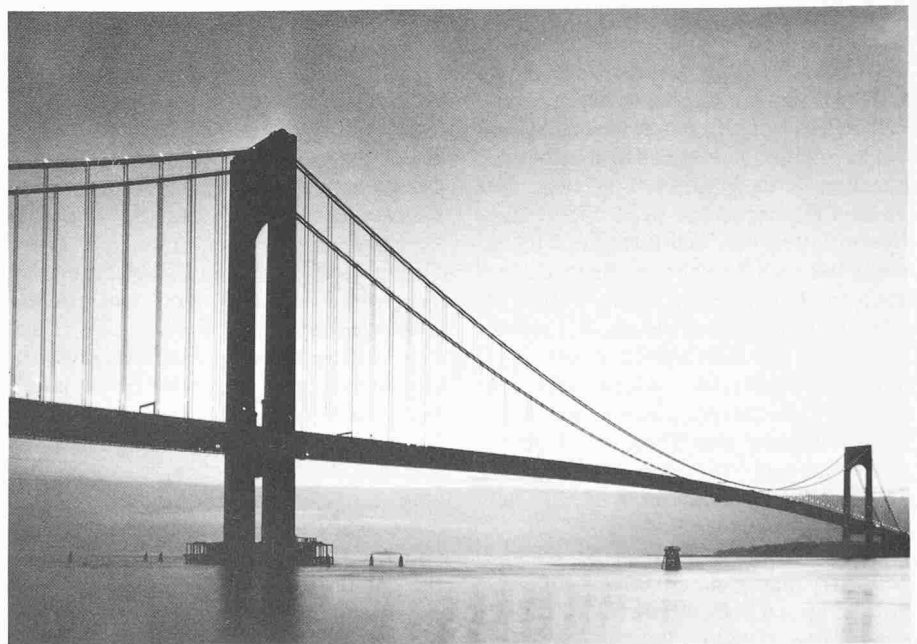
Verrazano-Brücke (1964), New York, Spannweite 1298 m

Nach einer kurzen Zeit der Ungewissheit setzten sehr bald die Anstrengungen zum Wiederaufbau der kriegsverwüsteten Länder ein. Es folgte ein anhaltendes Wachstum auf allen Wirtschaftsgebieten. Dabei wurden auch dem Brücken- und Hochbau grosse und oft neuartige Aufgaben gestellt. In den