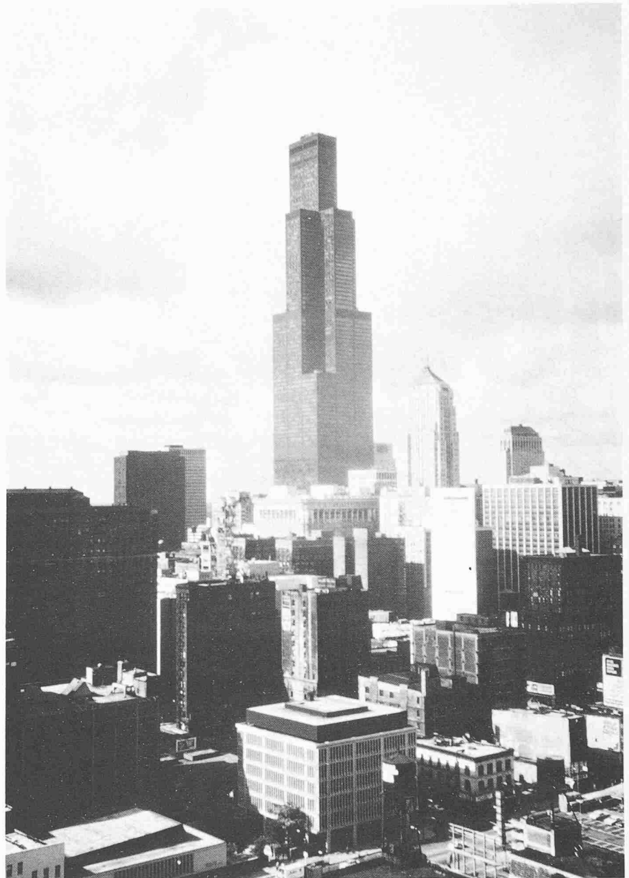
Sears Tower (1974), Chicago, Höhe 443 m

Der Bauablauf bei der Durchführung grosser Bauaufgaben nimmt heute einen immer komplexeren Charakter an. So kommt der Steuerung und Kontrolle von der Planungsphase über alle weiteren Schritte bis zum Bezug und Unterhalt des Bauwerkes eine immer grössere Bedeutung zu. In Zukunft werden sich auch Baufachleute mit diesen Problemen vermehrt befassen müssen, um möglichst wirtschaftliche sowie sinnvolle und ästhetisch soweit als