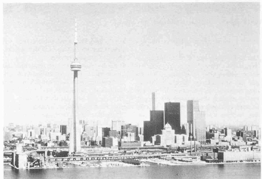
CN-Tower (1976), Toronto, Höhe 550 m