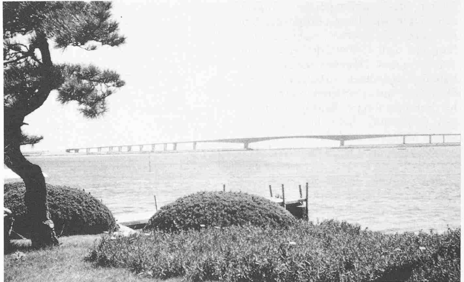
Hamana-Brücke (1978), Japan, Spannweite 240 m

stens einmal die Tätigkeiten und Veranstaltungstermine mit den folgenden internationalen Gremien gegenseitig abgestimmt: