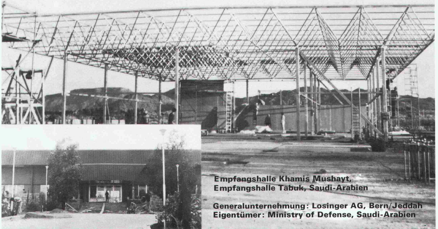
Empfangshalle Khamis Mushayt, Empfangshalle Tabuk, Saudi-Arabien

Monbijoustrasse 16 Telex 33260 mapa ch, Tel. 031 25 43 55/56