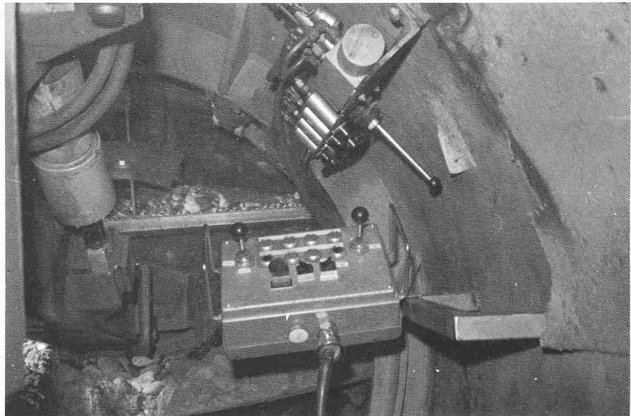
«Fahrersitz» mit Steuerungspult

Da die Maschinen dem Fahrer eine ausgezeichnete Beobachtung der Ortsbrust gewährleisten, kann jederzeit ein optimaler Abbau erfolgen. Dies ist von Vorteil, wenn – wie auf einer anderen Baustelle – Rollkies aufgefahren werden muss. Durch den Einbau einer Schild-