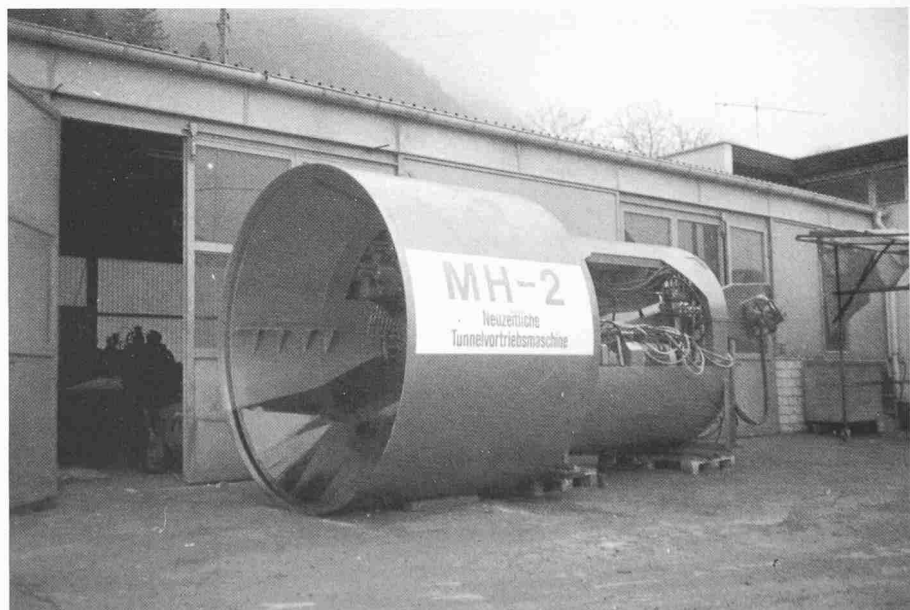
Nachlaufrohr (Power unit)