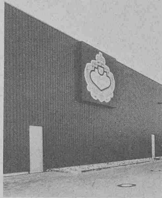
Thyssen-Thermowand. Typ VT 66 ( k = 0,559 W/m 2 K)

Die Wärmeleitzahl des diffusionsdicht eingeschlossenen Pur-Hartschaumes beträgt 0,029 W/mK (0,025 kcal) und ergibt dabei Wärmedurchgangszahlen von k = 0,795 W/mK (0,684 kcal) bei 37 mm Wandstärke bis zu k = 0,161 W/mK (0,138 kcal) bei 180 mm Dicke. Dichte Elementstösse und der