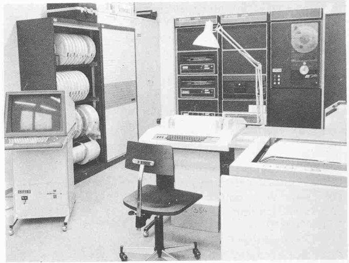
Fig. 4. Mini-ordinateur universel (PDP11-34) avec, entre autres, une imprimante/traceur de courbes électrostatique et un écran graphique

chiffres, alors que le langage graphique est le mode de transfert de l'information le plus utilisé par l'ingénieur et que le matériel nécessaire à la représentation graphique des résultats existe depuis plus de 15 ans (traceur de courbes vectoriel).