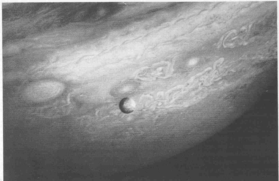
Der wohl aktivste Himmelskörper unseres Sonnensystems ist der Jupiter-Mond Io – hier von der amerikanischen Raumsonde Voyager 2 aus ungefähr 12 Millionen Kilometer Entfernung vor der turbulenten Gashülle der südlichen Hemisphäre Jupiters fotografiert. Bei heftigen Vulkanausbrüchen auf Io, er ist etwa so gross wie der Erd-Mond, werden winzige Ascheteilchen ausgeworfen, die auf Umwegen den Ring um Jupiter verursachen

Winzige Teilchen mit Radien kleiner als ein Zehntel Mikrometer (1 Mikrometer = 1 Zehntausendstel Zentimeter) in der Vulkanasche haben jedoch, so berechneten Grün und Morfill, durchaus eine Chance, den Anziehungsbereich Ios zu verlassen. Sobald die Staubpartikel nämlich über die dünne, bis in ungefähr 100 Kilometer Höhe reichende Atmosphäre Ios hinausgeschleudert werden, laden sie sich innerhalb von Sekunden elektrisch auf. Das geschieht entweder durch das Ultraviolett-Licht der Sonne (Photoeffekt) oder – dieser Prozess dürfte vorherrschen – durch das Bombardement energiereicher Plasmateilchen, die in den starken Strahlungsgürteln des Magnetfeldes um Jupiter eingeschlossen sind. Wie die Erde, weist nämlich auch der Jupiter eine weit in den Weltraum hinausreichende Magnethülle auf,