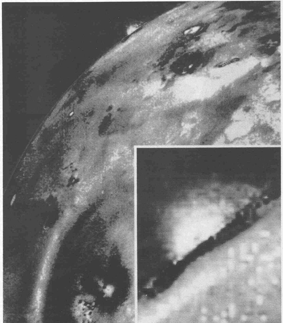
Ungestümer Vulkanausbruch auf dem Jupiter-Mond Io: Diese von Voyager 1 aus ungefähr 490 000 Kilometer Abstand gemachte Aufnahme zeigt am Horizont Ios einen explosionsartigen Vulkan-Ausbruch. Dabei wird feste Materie bis in 160 Kilometer Höhe geschleudert (innerer Bildausschnitt). Dies erfordert Auswurfgeschwindigkeiten von schätzungsweise 1920 Kilometer pro Stunde

Der wichtigste Grund: Die im Ring beobachteten Teilchen sind mit durchschnittlich 1 Mikrometer nicht nur ungefähr zehn- bis hundertmal grösser als die Io-Partikel, sie haben auch ganz andere Eigenschaften. Zum Beispiel lassen sie sich, im Gegensatz zu den Io-Teilchen, vom starken Magnetfeld Jupiters nicht beeinflussen, dazu sind sie zu schwer. Statt dessen bestimmen die Anziehungskraft des Riesenplaneten und der Strahlungsdruck des Sonnenlichts das Schicksal der Ring-Partikel. Unter diesen Einflüssen bewegen sie sich auf Spiralbahnen langsam auf den Riesenplaneten zu. «Spätestens nach 10 000 Jahren», so rechnet Dr. Morfill, «wären alle Ring-Teilchen in die turbulente Gashölle Jupiters eingetaucht