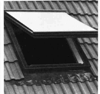
Reichhaltiges Zubehör: Rollos, Jalousetten oder Markisen.

Die eloxierten Aluminiumteile und der durchgefärbte Hart-PVC sind absolut witterungsbeständig und rostfrei. Zur Auswahl stehen 8 verschiedene Fenstergrößen und Verglasung nach Wunsch: Sonnenschutz-, Sicherheits-, Isolier- oder Thermopluglas.