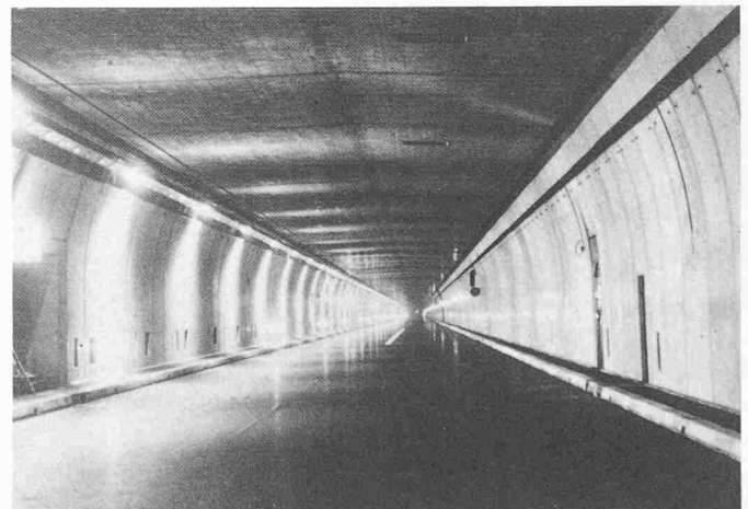
Bild 3. Notbeleuchtung mit eingeschalteter Brandnotbeleuchtung