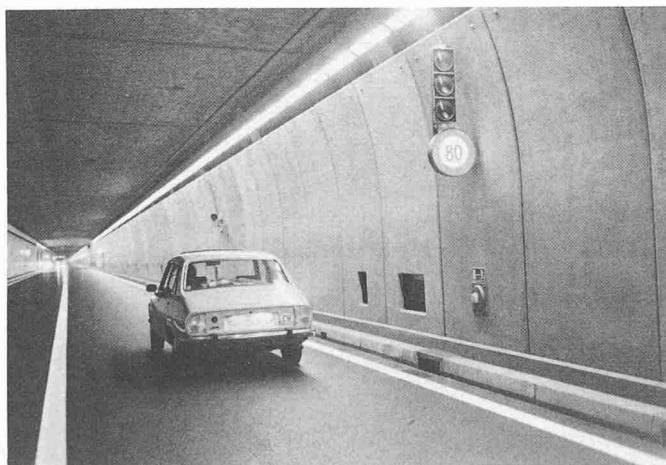
Bild 2. Beleuchtung der Mittelzone

Obwohl der Gotthard-Strassentunnel mit einer äusserst zuverlässigen Energieversorgung ausgestattet ist, muss mit zeitweiligen Spannungsunterbrüchen gerechnet werden. Sie können sowohl den ganzen Tunnel umfassen, als auch partiell , infolge eines Defektes in der tunnelinternen Verteilung, auftreten. Diese Unterbrüche bewirken einen Ausfall der Tunnelbeleuchtung und damit verbunden eine plötzliche Reduktion der Sichtweite. Bei einem Fahrzeuglenker kann dies zu Fehlreaktionen und als Folge davon zu einem Unfall führen. Nebst Fahrzeugen, die wenigstens mit einer eigenen Beleuchtung ausgestattet sind, die bei der Durchfahrt eingeschaltet ist, muss im Tunnel mit Fussgängern ( Pannenfahrzeuge ) gerechnet werden. Um diese Gefahrenquellen auszuschalten, ist der Tunnel mit einer Notbeleuchtung versehen. Sie ist in die Normalbeleuchtung integriert, so dass keine speziellen Notleuchten installiert werden mussten. Jede zehnte Leuchte der Fluoreszenzbeleuchtung wird dauernd von einem Wechselrichter gespeist. Bei vorhandenem Netz erhält der Wechselrich-