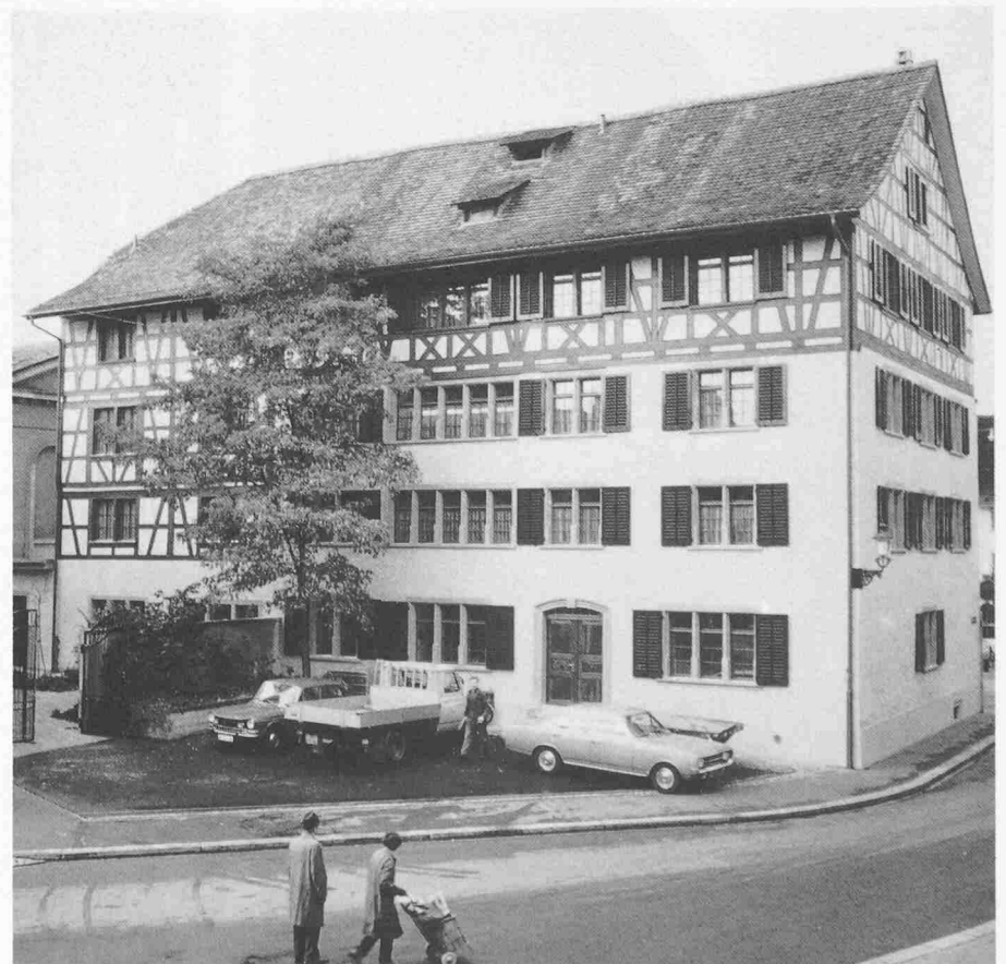
Die Ostfassade vor der Restaurierung