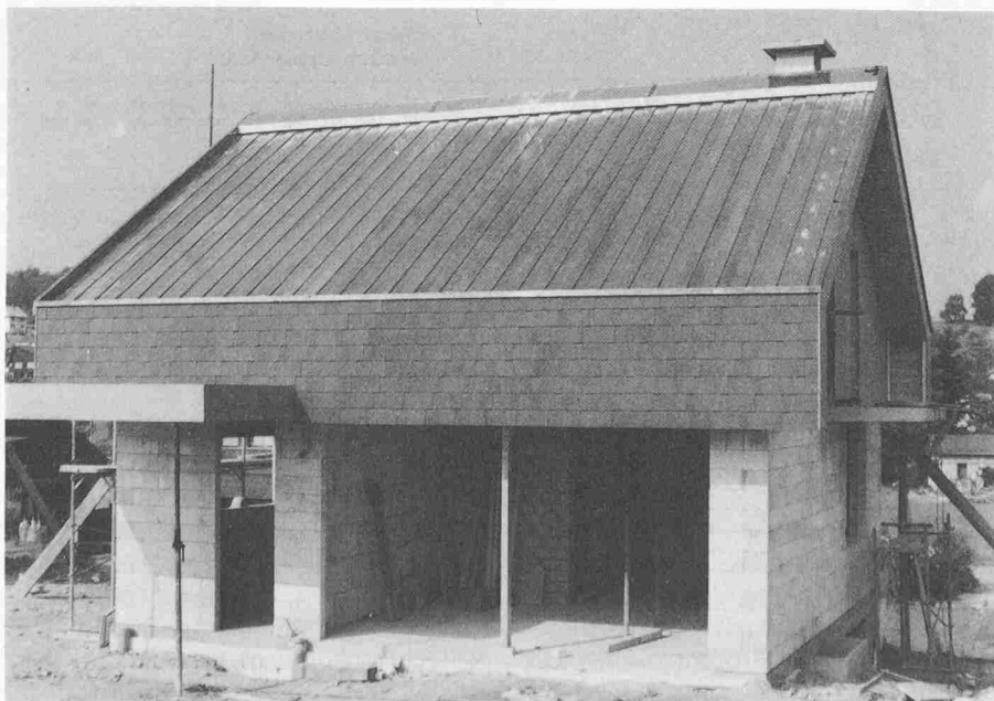
Bild 1. Energiedach Sessa-Therm

Das Energiedach Sessa-Therm ist ein Metaldach, mit dem der Umwelt – aus Sonne, Regen und Nebel – Wärme entzogen wird. Die Wärme wird mittels einer Wärmepumpe auf ein höheres Temperaturniveau gebracht, so dass sie für die Raumheizung und die Erwärmung des Brauchwassers verwendet werden kann. Das Energiedach Sessa-Therm ist aber nicht nur ein Wärmetauscher zur Aufnahme der Umweltwärme, sondern auch ein wasserdichtes, isoliertes Dach. Es ersetzt somit die herkömmliche Dacheindeckung inkl. Isolation.