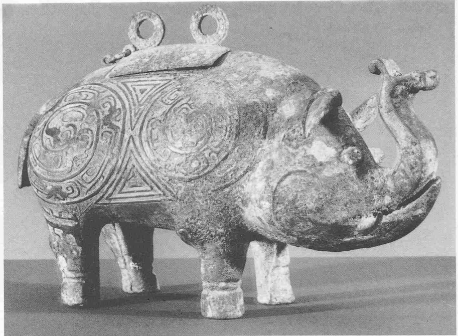
Zun in Gestalt eines Elefanten, westliche Zhou-Dynastie, 10. Jahrhundert v. Chr., Bronze