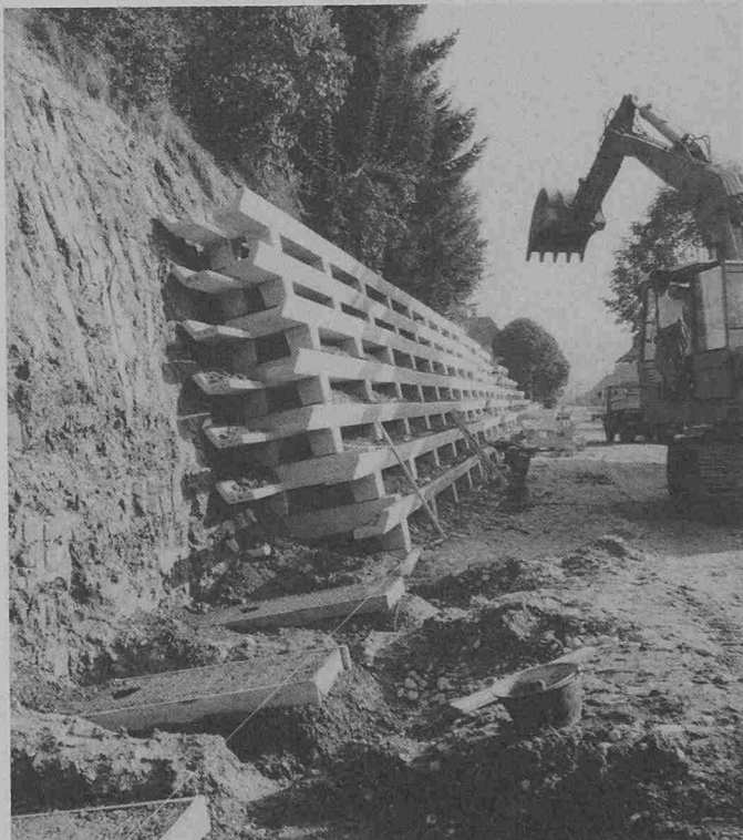
Bau einer Stützmauer an der Staatsstrasse Walkringen (BE)

Wachstums Voraussetzungen sind deshalb besonders gut, weil die grossen Erdkammern die Pflanzen im Wachstum nicht einschränken und andererseits die Längsträger winkelförmig ausgebildet sind. Die Feuchtigkeit im dahinter liegenden Erdreich ist dadurch gegen Fahrwind und gegen Sonne besser geschützt. Um den Unterhalt der Pflanzen auf ein Minimum zu vermindern, werden mit Vorteil widerstandsfähige, bodenbedeck-