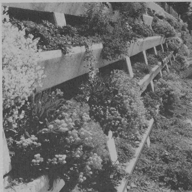
Detail aus einer bepflanzten Stützmauer