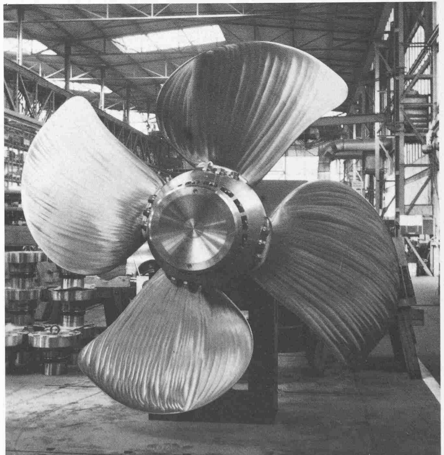
Verstellpropeller für einen Tanker mit ausgeprägter Flügelrücklage («skew»)

Feste Kaufabsichtserklärungen auf insgesamt zehn Hochleistungsanlagen für Spezialschiffe lassen die nur im (augenblicklich depressiven) Schiffbaumarkt tätige Abteilung des seit über 40 Jahren bedeutenden Herstellers mit gewisser Zuversicht in die zweite Jahreshälfte blicken.