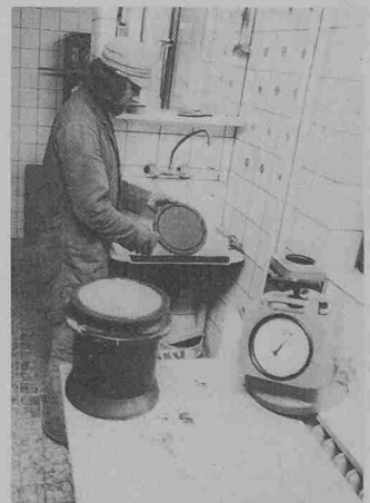
Neuer Luftgehaltsprüfer Porotest für Beton. Alle Bedienelemente, das grossflächige Manometer und eine Wasserkammer sind in den kompakten Gerätekopf eingebaut, der durch zwei Schnellverschlüsse mit dem Probenbehälter verspannt wird

gen verdreifacht wurde. Bei einer Betätigungskraft von etwa 0,08 kN (8 kp) ist die Druckkammer bereits mit sechs Kolbenhüben gefüllt; der Kammerdruck wird dann durch Betätigen eines Fingertip-Ventils auf die Prüfmarke eingestellt.