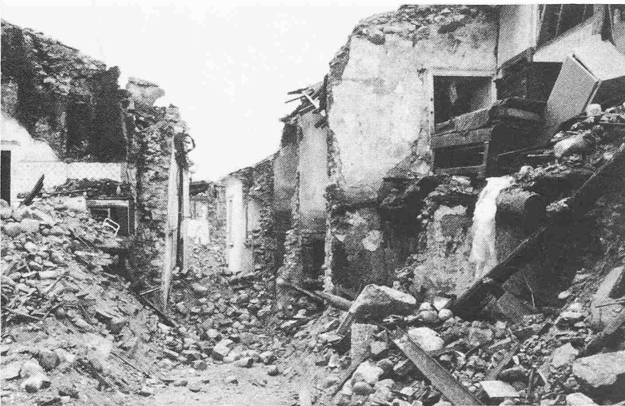
Bild 3. Alter Dorfkern von San Angelo dei Lombardi

Besonders spektakulär sind zwei Rutschungen bei San Fele und eine Rutschung in Calitri. Alle drei sind mehr als 500 m breit und bis zu 1,3 km lang. Die grösste Verschiebung von gegen 150 m wurde bei einem der beiden westlich von San Fele gelegenen Rutschungen beobachtet. Die Gebäude im Rutschungsgebiet wurden dabei vollständig zerstört. Grösste Schäden an alten und neuen Gebäuden verursachte die Rutschung, die weite Teile des Städtchens Calitri erfasste (siehe Bild 2), wobei der durch das Beben direkt verursachte Schaden weniger ins Gewicht fällt. Die Anrisszonen der verschiedenen Teilrutschungen im oberen Teil des Städtchens weisen sowohl horizontale