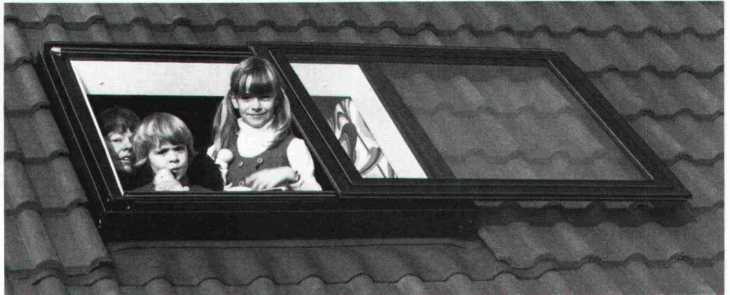
Das Braas-Atelierfenster lässt den Sonnenschein herein.

Zum behaglichen Wohnen in einem Dachraum gehört das Tageslicht, der freie Ausblick zum Himmel und in die Natur. Aber versuchen Sie einmal, die Sonne so richtig hereinzulassen, wenn sich das Dachfenster nur bis zu einer bestimmten Öffnung hochkippen lässt. Oder wenn schon, wie klappen Sie ein ganz aufs Dach hochgelegtes Fenster wieder mühelos zurück?