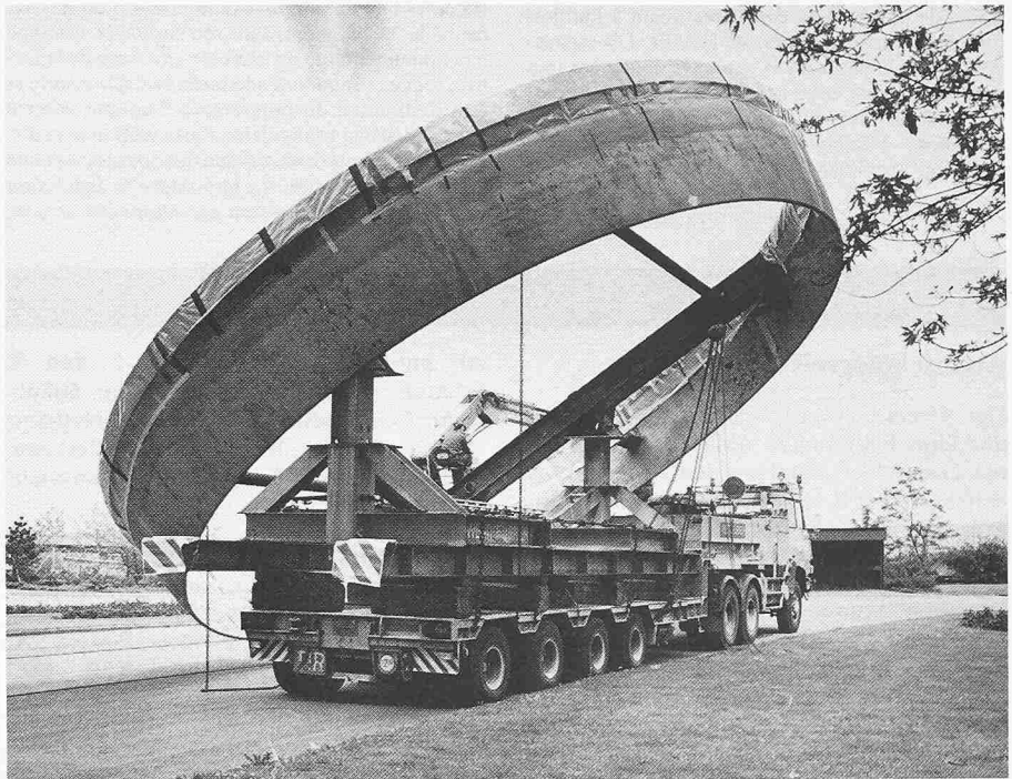
Drywell-Deckel aus Stahl. Teil der Kalotte mit 9,40 m Breite und 1,50 m Höhe, transportbereit

Ende Mai 1981 erfolgte der Transport. Der Sattelschlepper startete in Birr kurz vor Mitternacht. Eine Polizeibegleitung sperrte abschnittsweise die Strasse, da ein Kreuzen unmöglich war. Strassenlampen und Verkehrs-