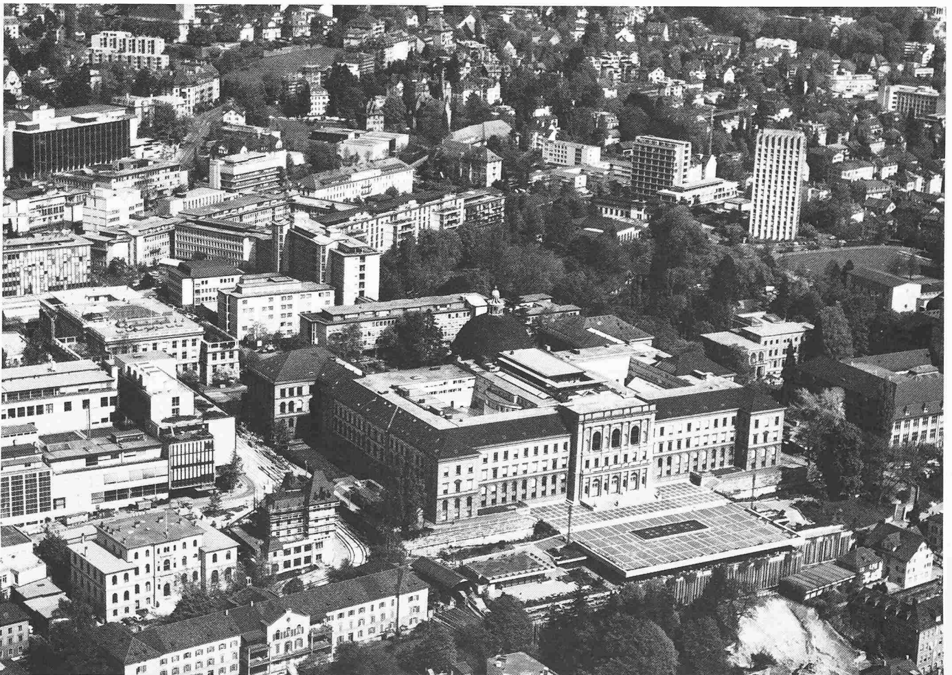
ETH-Zentrum. Im Vordergrund die neue Mensa samt Sporthallen unter der Polyterrasse. Hinten links: Neubau (Elektrotechnik) anstelle des alten Physikgebäudes

Tief empfundener Dank geht an unserem Feiertag besonders an das Schweizervolk , das die ETH Zürich möglich macht. In der Bundeskasse