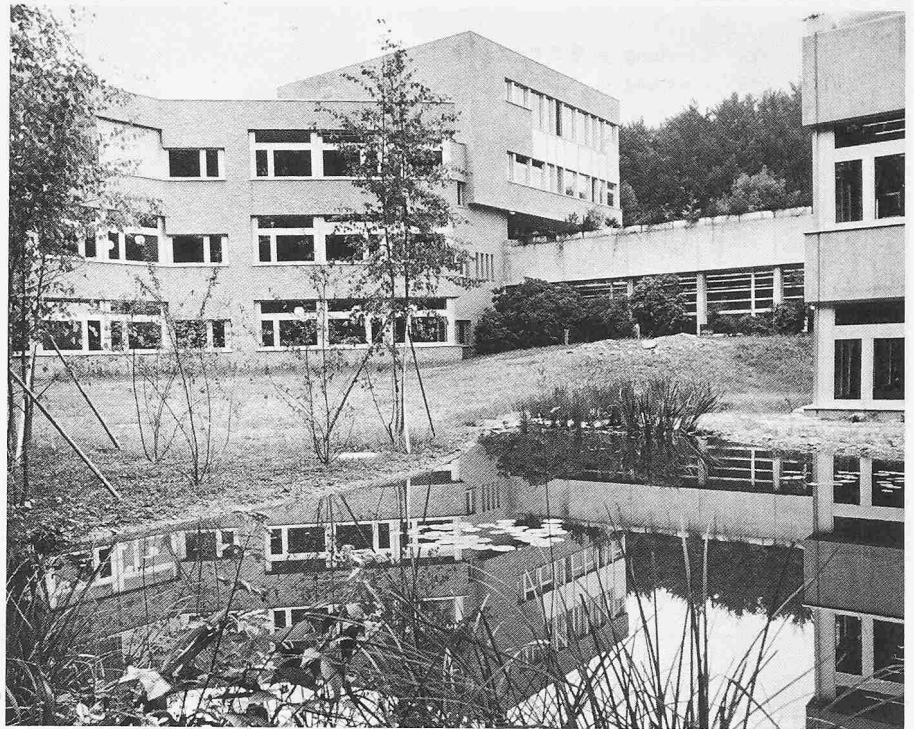
Bild 8. Schulhaus Juch vom Biotop her gesehen