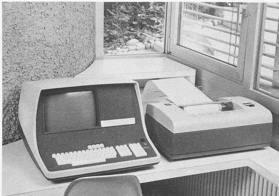
Bild 2. Die Bademeister haben Drucker und Bildschirm in ihrer Kabine

Die Bademeister haben Drucker und Bildschirm in ihrer Kabine (Bild 2). Nach Pflichtenheft muss jeder Abwart sein Haus bei allfälligen Pannen wie