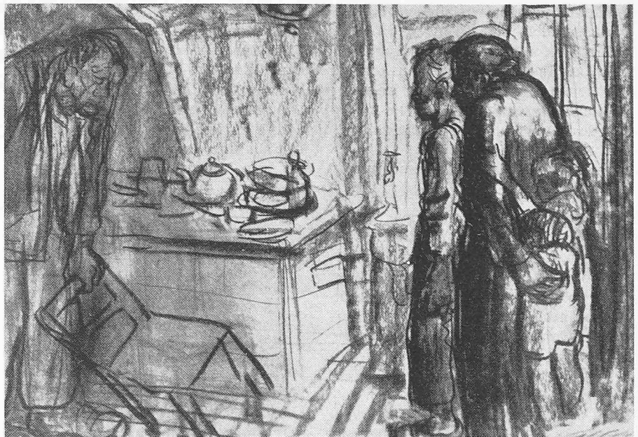
Käthe Kollwitz: «Trinker bedroht Familie»

Heinrich Zille (1885–1929). In volkstümlich humoristischen und zugleich satirisch anklagenden Zeichnungen schilderte er das «Milljöh» des Berliner Proletariats. «Vater Zille» genoss grosse Popularität über die Elendsquartiere hinaus, wo er sein einfaches, arbeitsames Leben grösstenteils in einer zweifelhafte Stube beim Bahnhof Westend verbrachte. Als Autodidakt gewann der Zeichner und Maler Zille (später Mitglied der Akademie) bedeutendes Ansehen. Hierzu trug auch seine Mitarbeit für die «Jugend», den «Simplicissimus» und andere illustrierte Blätter bei.