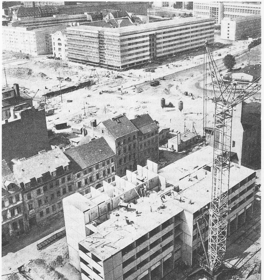
Berlin: Abbruch der alten Häuser an der Fischerstrasse, im Vordergrund Montage von Hochhäusern. Von der Trostlosigkeit in die Öde...

Die Städte leben von der Einsicht und der menschlichen Kraft, die das innerlich Erkannte dem äusserlich Gestaltbaren gegenüber zur Gestaltung bringt.