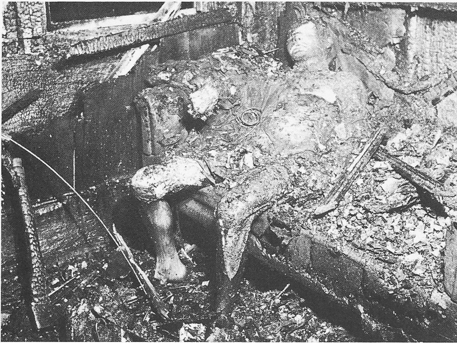
Personenschutz durch Brandschutz rettet Menschenleben!

VKF wahr, indem sie technische Richtlinien ausarbeitet. Sie sind als «Wegleitungen für Feuerpolizei-Vorschriften» publiziert.