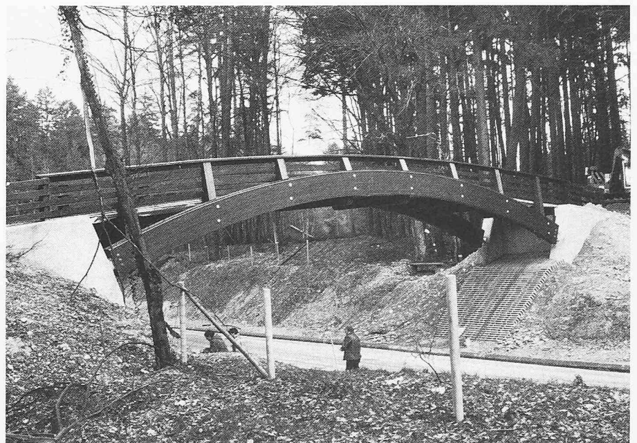
Ansicht der neuen Holzbrücke