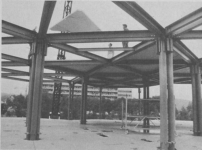
Die vier Grundelemente des Systems: Nahtlos gezogene Rohrstützen, Radial- und Randträger aus gekantetem Stahlblech und der die Radialträger verbindende Stern

die Fassadenelemente oder Trennwände, sondern auch auf Stiegenhäuser, Installationsleitungen usw., die auf Grund der bisher nicht bekannten Genauigkeit nur mehr montiert