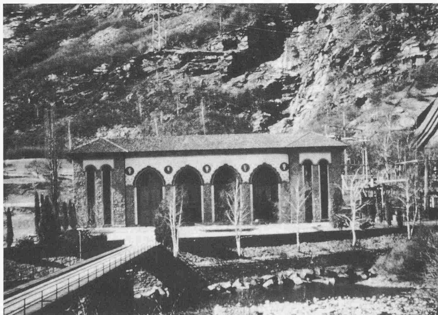
Bild 1. Centrale del Piottino, Lavorgo

Nachdem die Werke Biaschina und Tremorgio in Betrieb waren, war es eines der ersten Anliegen der AET, den Strom auf eigenen Netzen im ganzen Kantonsgebiet verteilen zu können. So kaufte sie zuerst von der ATEL die 50-kV-Leitungen, die den Stromtransport von Bodio nach Airolo, von Bodio-Pollegio nach Acquarossa und von Bodio nach Morobbia und Riazzino erlaubten. Später erstellte die AET die folgenden Leitungen: 150-kV-Linien