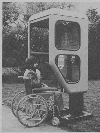
Das Fernsprechhäuschen ist für Behinderte mit Rollstühlen leicht zugänglich (wobei noch etwas Arbeit durch den Pflasterer zu leisten ist! Red.)

Die Fernsprechhaube FeHb 82 besteht aus einer mit Baydur umschäumten Metallrahmen-Armierung, wobei die erforderlichen Aussparungen und Leitungsdurchbrüche bereits beim Schäumprozess berücksichtigt werden. Die Haube ist optisch und funktionell der neuen Generation der geschlossenen Bundespost-Fernsprechhäuschen angepasst. Sie ist durch die tief heruntergezogenen Seitenteile ausreichend wettergeschützt und kann mit allen postüblichen Münzautomaten – auch mit den vorgesehenen münzlosen Karten-Fernsprechapparaten – ausgerüstet werden. Zur Ausstattung gehören ferner Ablagemöglichkeiten und Telefonbuchschwingen sowie ein Dämme-