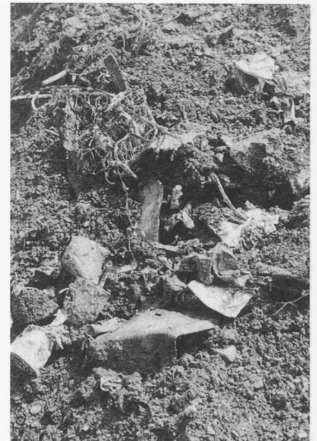
Bild 1. Kehrriechtschlacke, wie sie aus der Verbrennungsanlage anfällt (Nahaufnahme)

In der Schweiz hat sich zur Beseitigung des Kehrriechts die Verbrennung durchgesetzt. Bei diesem Verfahren verbleiben jedoch 30 Gew.-% des anfallenden Kehrriechts als Schlacke, die zu deponieren ist oder verwertet werden kann (Bild 1). Die Kezo Hinwil (Kehrriechtsverwertung Zürcher Oberland) hat nach Angaben von Dr. E. Suter seit vielen Jahren versucht, ihre Schlacke weiterzuverarbeiten. Es ist ihr dabei gelungen, mittels Sieb das Grobgut und mittels Magnet den Schrott zu separieren (Bild 2). Die verbleibende aufbereitete Kehrriechtschlacke konnte problemlos bei Waldstrassen eingebaut werden. Diese Absatzmöglichkeit ist zurzeit ins Stocken geraten. Andererseits wächst die spezifische Abfallmenge. Sie hat sich in