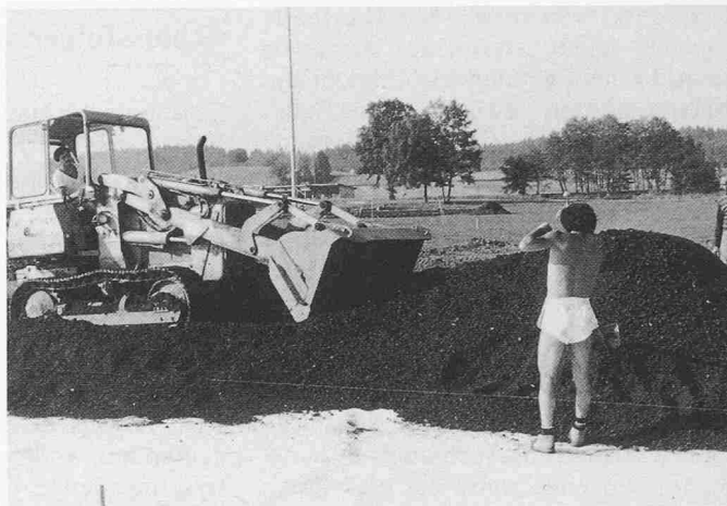
Bild 3. Verteilen und Planieren der zementstabilisierten Kehrichtschlacke auf der Baustelle. Die Verarbeitung kann auch mit einem Fertiger erfolgen

reichlich Sand. Der hohe Feinanteil (vor allem im Bereich von 0,06 - 0,2 mm Korndurchmesser) macht sie wasserempfindlich. Eine Zementbeigabe von 70-80 kg/m 3 reduziert die Wasseraufnahmefähigkeit, erhöht die Frostbeständigkeit und bewirkt eine zunehmende Druckfestigkeit (4 N/mm 2 nach 28 Tagen). Kehrichtschlacke hat eine Trockenrohdichte von nur 1,7 t/m 3 , was auch die Frosteindringtiefe verringert. Feldversuche mit Deflektionsmessungen haben ergeben, dass sich stabilisierte Kehrichtschlacke gleich verwenden lässt wie stabilisierter Kiessand .