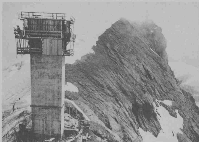
Bau der Fernmelde- und Mehrzweckanlage der PTT auf dem Titlis. Doka-Selbstkletterschalung für den 62 m hohen Liftschacht