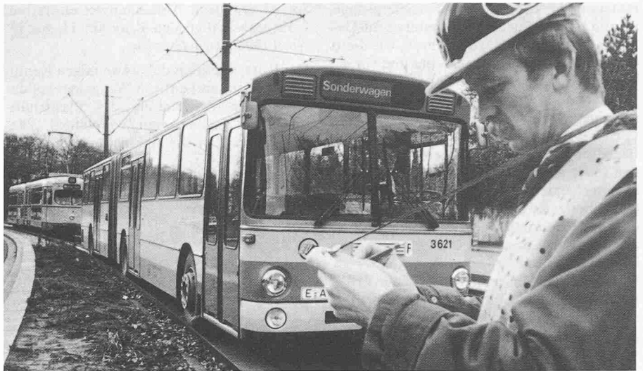
Autobus und Strassenbahn können auf der Essener Teststrecke auf gemeinsamer Gleisstrecke fahren

(pd). Die Schiene zur Strasse macht die Krupp Handel GmbH in Essen. Der Produktbereich Gleistechnik hat hierzu ein spezielles Fahrbahnbalcken-System aus Stahlbeton mit justierbaren Leitkanten entwickelt, das Linienbussen das Befahren von Gleiskörpern ermöglicht. Die Leitplanken sind so befestigt, dass der eingleisende Bus durch seitliche Lenkrollen automatisch in der Mitte des Spurkanals gehalten wird. Zur Erprobung der Fahreigenschaften hat die Essener Verkehrs-AG eine Teststrecke errichten lassen, auf der im Frühjahr 1983 die Möglichkeiten eines Parallelbetriebes von Bus und Strassenbahn auf dem kombinierten Fahrweg Schiene/Strasse untersucht werden sollen. Nach Abschluss dieser Versuche werden voraussichtlich 1983/84 die Gleise einer Tunnelstrecke der Unterpflaster-Strassen-