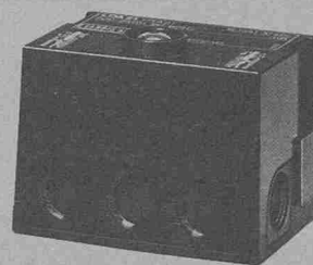
Ölfeuerungsautomat LOA 21 für Zerstäubungsbrenner kleiner Leistung im intermittierenden Betrieb.