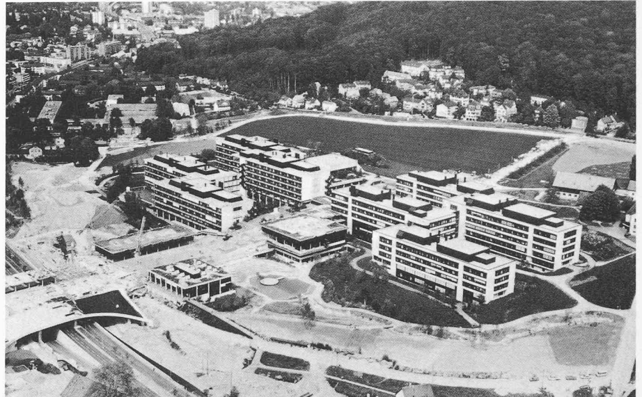
Luftaufnahme. Im Vordergrund rechts die 2. Etappe, Mensa; links der Neubau des Staatsarchivs

Bewilligung eines Bruttokredites von Fr. 29,4 Mio. für die Infrastrukturanlagen durch den Kantonsrat (Parkhaus, Verkehrsanschluss, Fussgängerbrücke)