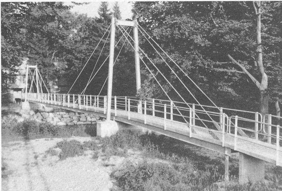
Bild 1. Fussgängersteg über die Emme in Biberist-Gerlafingen

Fussgängerstege stehen nicht im Rampenlicht der modernen Brückenbaukunst. Trotzdem ist es reizvoll, eine solche Bauaufgabe aus der Sicht der heutigen Bautechnik zu überdenken und nach neuen Lösungen zu suchen.