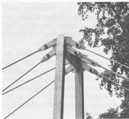
Bild 6. Pylonkopf mit Anschluss der Zugstangen

ebene konnte auf räumliche Anschlüsse verzichtet werden.