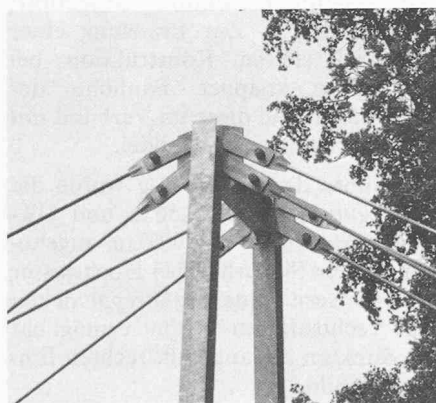
Bild 6. Pylonkopf mit Anschluss der Zugstangen

ebene konnte auf räumliche Anschlüsse verzichtet werden.