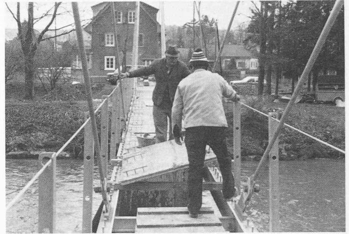
Bild 3. Montagezustand