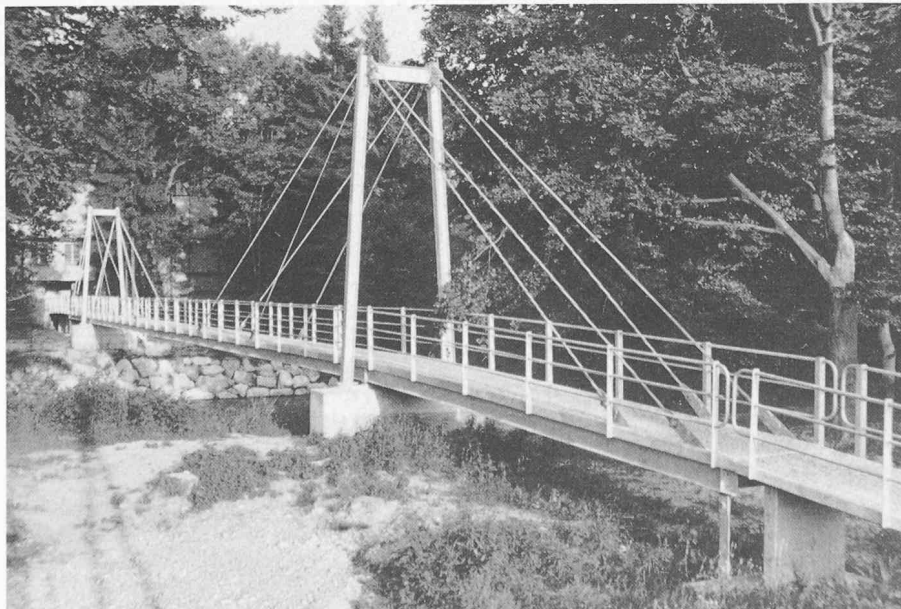
Bild 1. Fussgängersteg über die Emme in Biberist-Gerlafingen

Fussgängerstege stehen nicht im Rampenlicht der modernen Brückenbaukunst. Trotzdem ist es reizvoll, eine solche Bauaufgabe aus der Sicht der heutigen Bautechnik zu überdenken und nach neuen Lösungen zu suchen.