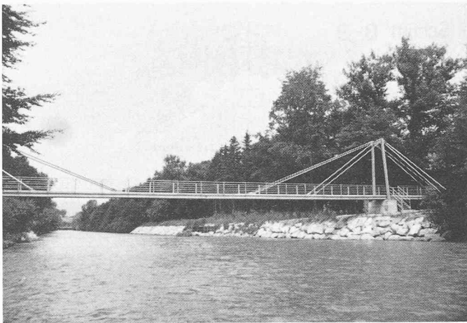
Bild 2. Ansicht des Steges von Oberwasserseite