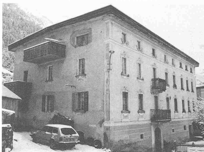
- Gebäude mit Baujahr um 1900 (besonders häufig in den durch Brände weitgehend zerstörten Dörfern)