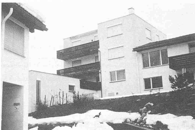
- Gebäude aus den Siebzigerjahren