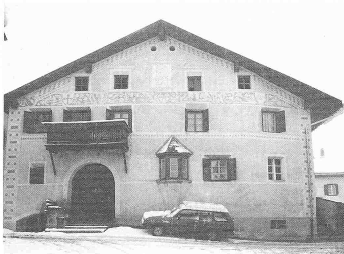
- Trad. Bauernhaus 17. Jahrh. (Um- und Ausbauzustand sehr unterschiedlich!)