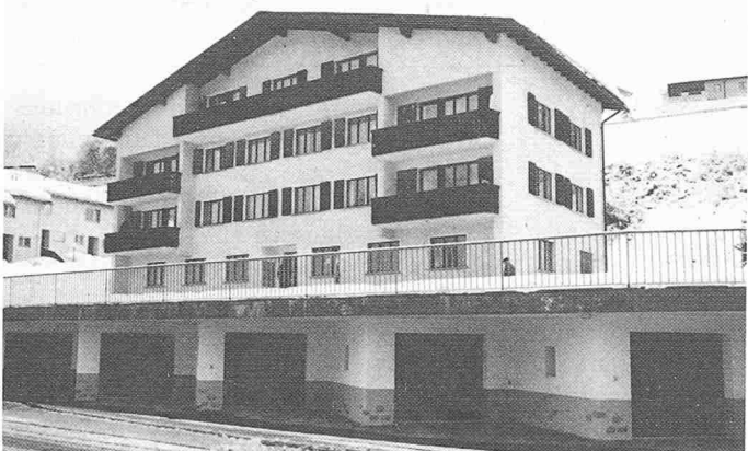
- Gebäude aus den Sechzigerjahren