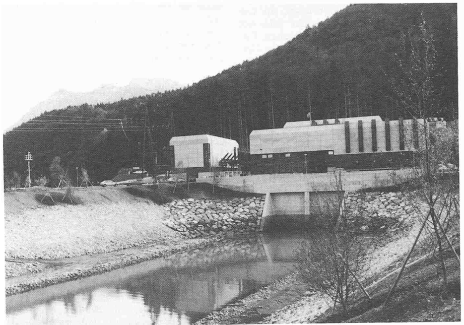
Krafthaus bei Beschling

Ebenso wichtig sind die während der letzten zehn bis 15 Jahre von Wetter-Satelliten aus erfolgten Beobachtungen. Deren Messdaten und Bilder der Erdoberfläche sind meist archiviert. Gewässerverhältnisse lassen sich damit über Jahre zurückverfolgen.