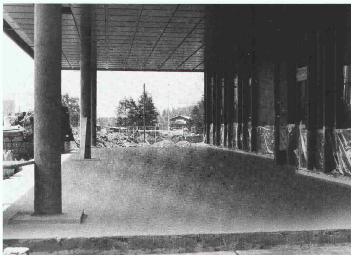
Eingangshalle Kläranlage Als wasserdichte Isolation unter Plattenbelag