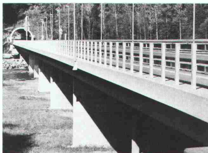
Autobahnbrücke Als frost- und tausalzbeständige Beschichtung

Barralastic: die vielseitige elastische Zementschlämme